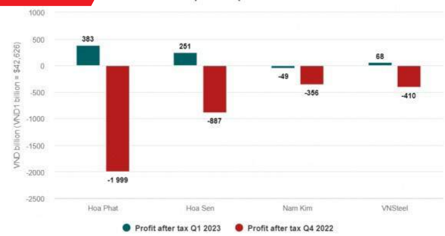
Steel companies' profit after tax